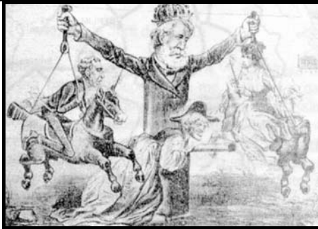
O Mequetrefe, 09 jan 1878.

A charge faz alusão à prática política do Segundo Reinado, quando o Imperador tinha grande influência na dinâmica político-partidária. Esta ascendência do monarca pode ser explicada devido