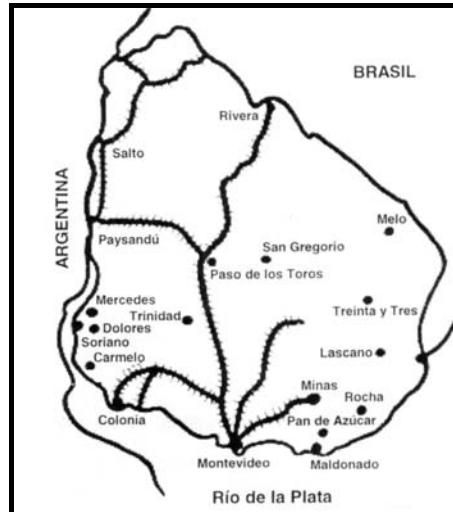
Uruguai na década de 1880

Considerando o desenho da malha ferroviária de cada um dos países e a forma como ambos se inserem no sistema capitalista do final do século XIX, analise as afirmações que seguem.