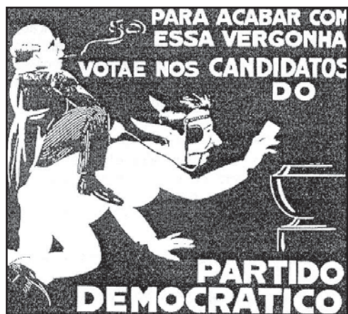
VICENTINO, Cláudio; DORIGO, Gianpaolo. História do Brasil . São Paulo: Scipione, 1997. p. 204.

A partir do que a gravura sugere, pode-se dizer que ela faz alusão à prática da